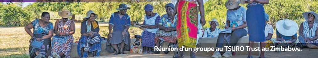
Réunion d'un groupe au TSURO Trust au Zimbabwe.

Cette année, le Fonds du primate a travaillé avec 70 partenaires dans 32 pays, obtenant des résultats importants, mais aussi des enseignements significatifs qui conduisent à de meilleures pratiques dans les communautés où travaillent nos partenaires.