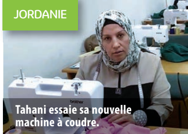
Tahani essaie sa nouvelle machine à coudre.