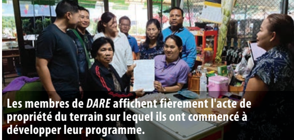
Les membres de DARE affichent fièrement l'acte de propriété du terrain sur lequel ils ont commencé à développer leur programme.