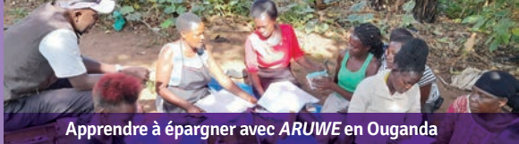
Apprendre à épargner avec ARUWE en Ouganda

A lors que le Fonds du primat pour le secours et le développement mondial achève sa 64 e année de soutien au développement durable et à l'aide humanitaire dans le monde entier, les résultats de notre travail nous enseignent de nombreuses leçons qui sont inestimables pour les futures programmes et partenaires.