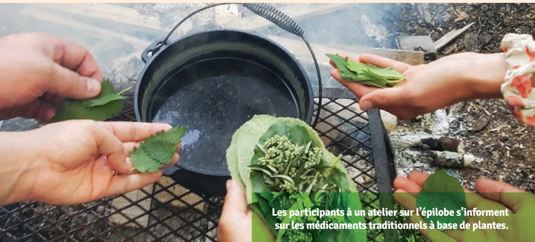
Les participants à un atelier sur l'épilobe s'informent sur les médicaments traditionnels à base de plantes.

En août 2021, le Fonds du primat pour le secours et le développement mondial a lancé un nouveau programme destiné à augmenter le nombre de nos partenaires autochtones au Canada. Sur les conseils du comité consultatif du programme autochtone du groupe, composé de dirigeants autochtones de tout le Canada, la Nouvelle subvention du Programme autochtone a commencé à fournir des fonds allant de 5 000$ à 15 000$ à des groupes axés sur l'eau potable, la participation des jeunes, la santé communautaire et l'action climatique. Depuis son lancement, le fonds a reçu 110 000$ de dons et soutenu huit groupes autochtones et des interventions d'urgence à la lutte contre la COVID.