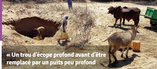
« Un trou d'écope profond avant d'être remplacé par un puits peu profond »

Dans le sud-est du Kenya, une sécheresse prolongée menace la santé et la sécurité alimentaire des communautés. Le Fonds du primat pour le secours et le développement mondial soutient l' Utooni Development Organization (UDO) avec la construction de puits d'eau peu profond. Durant la troisième année de ce projet, UDO a travaillé avec des groupes d'entraide pour construire dix puits d'eau peu profonds supplémentaires fonctionnant avec des pompes manuelles et cinq qui fonctionnent avec des pompes à eau submersibles alimentées par l'énergie solaire. Ensemble, ces puits fournissent de l'eau potable à 8,100 personnes. Les groupes d'entraide ont fourni du sable, de la gravelle, des roches et la main-d'œuvre alors qu'UDO a fourni le savoir technique ainsi que le matériel de construction et outils restants nécessaires. UDO a également formé les membres de la communauté à l'utilisation efficace de l'eau, au traitement de l'eau et à l'entretien des puits pour assurer la durabilité du projet.